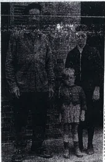
Les parents de Clotaire et leur petit-fils, orphelin de leur fille.

Le groupe auquel il appartenait avait vu venir, dans le brouillard, vers la fin du jour, un fort élément rebelle qu'il avait cru être des amis. Le Gal et un camarade métropolitain, probablement Castera, furent envoyés pour prendre liaison. Ce n'est qu'en arrivant à quelques pas de l'adversaire qu'ils reconnurent leur méprise. Ils furent désarmés et fait prisonniers. Les rebelles, surpris eux-mêmes, comprirent assez rapidement la situation. Ils assaillirent le petit groupe nettement inférieur en nombre. Au cours de l'accrochage il y eut des morts, un blessé et un spahis musulman fut également fait prisonnier. Selon plusieurs renseignements qui concordent, les trois disparus avaient été emmenés en captivité en Tunisie.