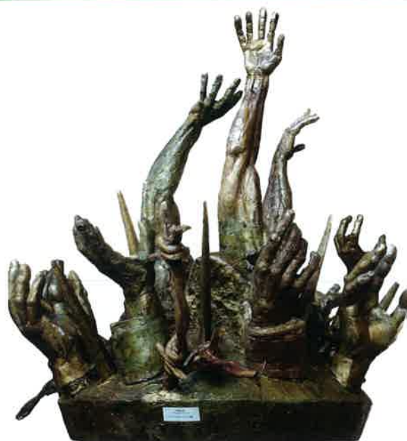
La sculpture est actuellement en cours de réalisation chez un fondeur